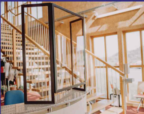
Mobile-Schutzabtrennungen für verschiedene Anwendungen